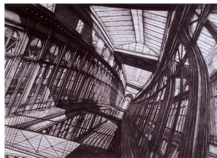
Galerie Véro-Dodat, 1989 © Erik Desmazières

Expression d'un talent varié et virtuose, 130 eaux-fortes et dessins parisiens d'Érik Desmazières restituent l'étrange poésie de la capitale. Le visiteur découvrira des vues de la ville telle que l'aperçoit et la perçoit l'artiste depuis les fenêtres de son atelier à Montmartre, mais aussi un impressionnant panorama du Quai de Montebello (2005) ou une attachante vue du Square d'Orléans (2005). L'ensemble le plus remarquable est constitué par la suite des Passages parisiens, projets d'agrandissement (7 planches ; 1988-1991) où l'on reconnaît ces lieux familiers au promeneur parisien que sont le passage Choiseul, la galerie Vivienne, la galerie Véro-Dodat ou le passage du Caire, démesurément amplifiés, déformés et magnifiés, à la façon d'un Piranèse.