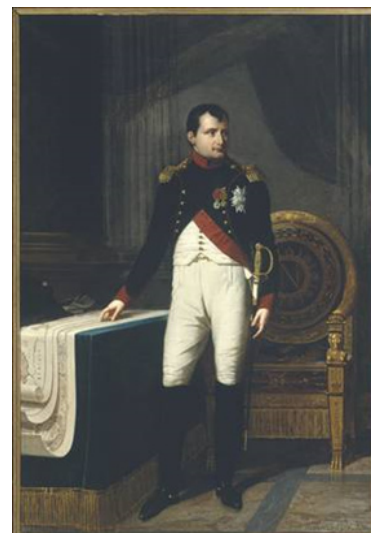
Napoléon Ier en uniforme de colonel des chasseurs de la garde commandé pour l'Hôtel de Ville de Paris, Robert Lefèvre, 1809 Huile sur toile 226 x 157 cm.