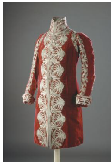
Habit de grand maréchal du palais porté par le général Bertrand, 1813. Velours de soie amarante (couleur rouge), broderies de fils lamés, paillettes et cannetilles argent. Musée Galliera

Les œuvres du musée Carnavalet dialoguent avec celles que prêtent des institutions – en particulier la Fondation Napoléon, le château de Compiègne, le château de Fontainebleau, le Palais Galliera, le musée du Louvre, le château de Versailles, le château de Malmaison – et des collectionneurs privés.