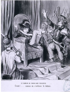
9- Le Gamin de Paris aux Tuileries Honoré Daumier (1808-1879) Lithographie, Le Charivari, 4 mars 1848 Paris, musée Carnavalet

Exposition du 5 octobre 2011 au 26 février 2012