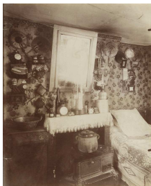
12- Petite chambre d'une ouvrière, Rue de Belleville, 1910 Eugène Atget (1857-1927) Photographie, tirage sur papier albuminé Paris, musée Carnavalet