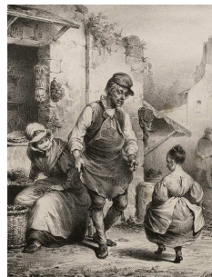
8- La Leçon de Danse, Edmé Jean Pigal (1798-1872) Lithographie de Frey Paris, musée Carnavalet