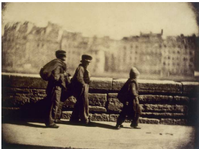
1- Les Ramoneurs en marche, avant mai 1852 Charles Nègre (1820-1880) Photographie, tirage sur papier albuminé Paris, musée Carnavalet