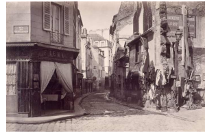
14- Rue de Lourcine, entre 1865 et 1868 Charles Marville (1813-1879) Photographie, tirage sur papier albuminé Paris, musée Carnavalet