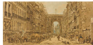
15- Le Faubourg et la porte Saint-Denis, 1801-1802 Thomas Girtin (1775-1802) Plume et lavis sépia rehaussés d'aquarelle sur papier épais Paris, musée Carnavalet