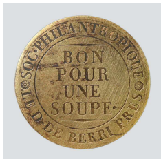
11- Jeton de la Société philanthropique pour une soupe , entre 1815 et 1820 Laiton, relief, uniface Paris, musée Carnavalet