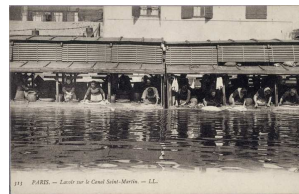
16- Lavoir sur le Canal St Martin , 1904 Léon et Lévy Carte postale, phototypie Paris, musée Carnavalet