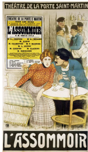
10- Affiche pour L'Assommoir donné au théâtre de la Porte Saint-Martin, 1900 Théophile Alexandre Steinlen (1859-1923) Lithographie en couleurs Paris, musée Carnavalet