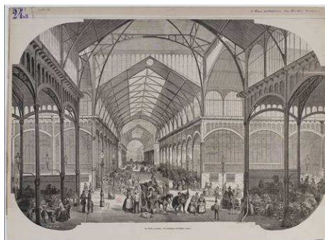
Les Halles : vue intérieure du pavillon central.

Toute cette atmosphère, fort bien décrite par Emile Zola dans « Le Ventre de Paris », est montrée dans cette exposition-dossier au travers de gravures, dessins, photos et cartes postales tirés des collections du musée Carnavalet.