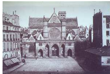
Charles Nègre, Saint-Germain l'Auxerrois , vers 1853 © PMVP / Degrâces

Le musée Carnavalet , musée de l'histoire de Paris, conserve des collections qui illustrent l'évolution de la ville, de la Préhistoire à nos jours. Installé dans deux hôtels particuliers au cœur du Marais, il présente, au milieu de décors historiques, un vaste choix d'œuvres d'art et de souvenirs évoquant la vie quotidienne et intellectuelle de la capitale.