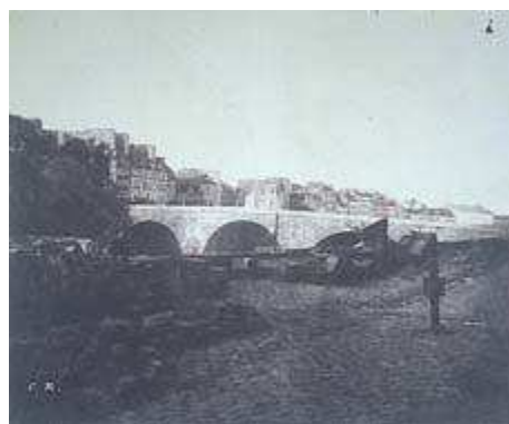
Charles Nègre, Quai de Seine et île de la Cité , 1851 © PMVP / Degrâces

Site Internet www.paris.fr/musees/musee_carnavalet