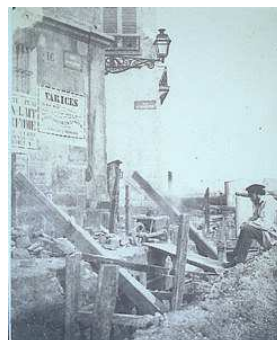
Charles Nègre, Travaux quai d'Orléans , 1851