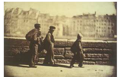
Charles Nègre, Les ramoneurs en marche , avant mai 1852