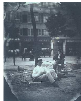
Charles Nègre, Terrassiers au repos , 1853

Une première présentation de ces acquisitions a eu lieu au musée d'Orsay du 11 juin au 28 juillet 2002, montrant l'ensemble des photographies entrées dans les collections publiques parisiennes à l'occasion de ces ventes aux enchères. La salle n°127 du musée Carnavalet, consacrée d'ordinaire à la peinture de la première moitié du XIX ème siècle, est aujourd'hui en partie réaménagée pour y disposer les images récemment arrivées au musée. En regard quelques gravures sur Notre-Dame et le baptême du fils de Napoléon III, conservées au sein du Cabinet des Arts graphiques (plus de 350 000 documents), montrent de quelle manière les photographies viennent s'intégrer à une collection iconographique sur l'histoire de Paris.