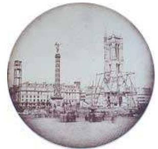
Charles Nègre, Restauration de la tour Saint-Jacques et fontaine du Palmier , vers 1853 – 1854